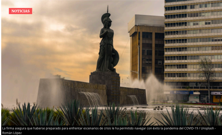
La firma asegura que haberse preparado para enfrentar escenarios de crisis le ha permitido navegar con éxito la pandemia del COVID-19